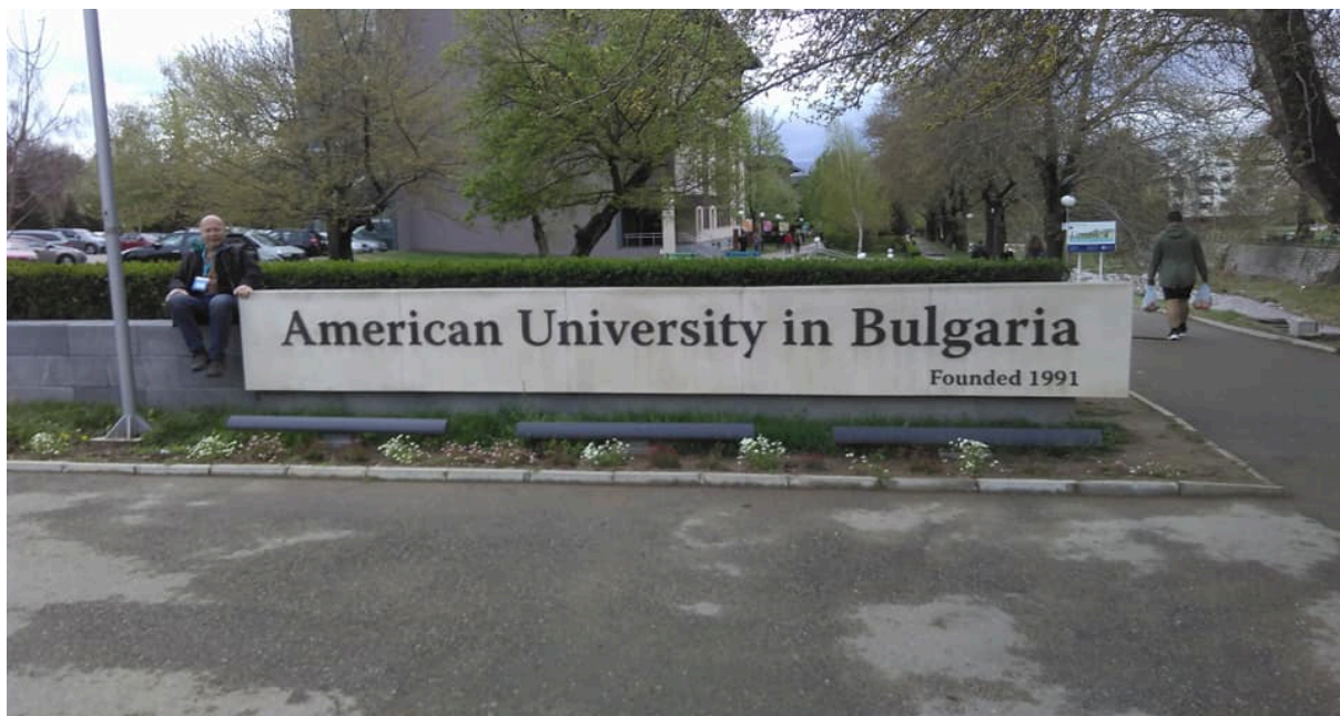
Slika 3:Predavatelj pred kampom AUBG

Že prvi dan se je predavatelj zelo dobro izkazal, saj je v sklopu predstavitve tipičnih nacionalnih jedi in pijače držav udeleženk navdušil vse prisotne s svojo predstavitvijo in ponudbo (krajnska