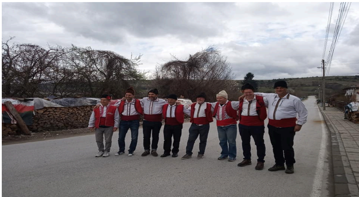
Slika 6: Moški del ekipe

Tretji dan je bil rezerviran za izlet v Gorno Dragište, kjer so se udeleženci spoznali z bolgarsko narodno kulturo in hrano. Udeleženci so se oblekli v narodne noše, se učili bolgarskega »kola« izdelovali narodno okrasje in nekatere tipične narodne jedi.