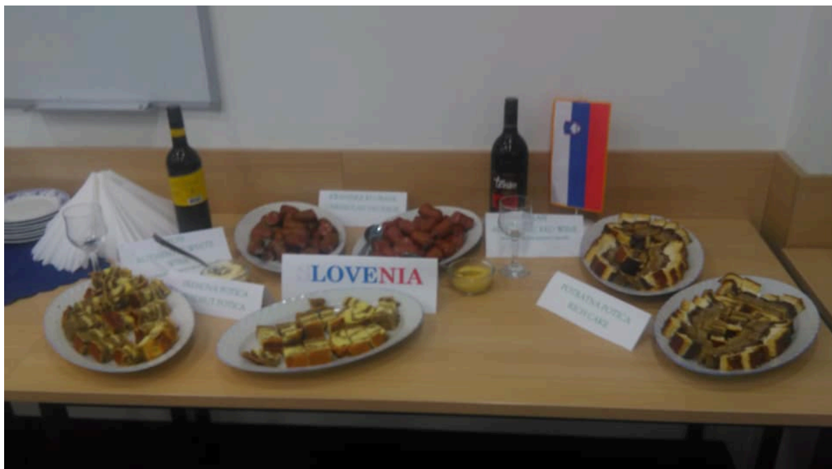
Slika 4: Predstavitev tradicionalnih jedi in pijače

klobasa, potica, potratna potica, teran, rebula), zato ne čudi, da je bila pred njegovo mizo kar velika gneča.