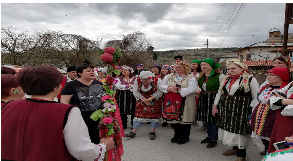
Slika 7: Ženski del ekipe

Pri tem je bilo resnično veliko dobre volje, saj so se udeleženci zelo dobro vklopili v samo dogajanje. Zvečer so se udeleženci udeležili še svečane podelitve vsakoletnih nagrad študentom univerze za izjemne dosežke.