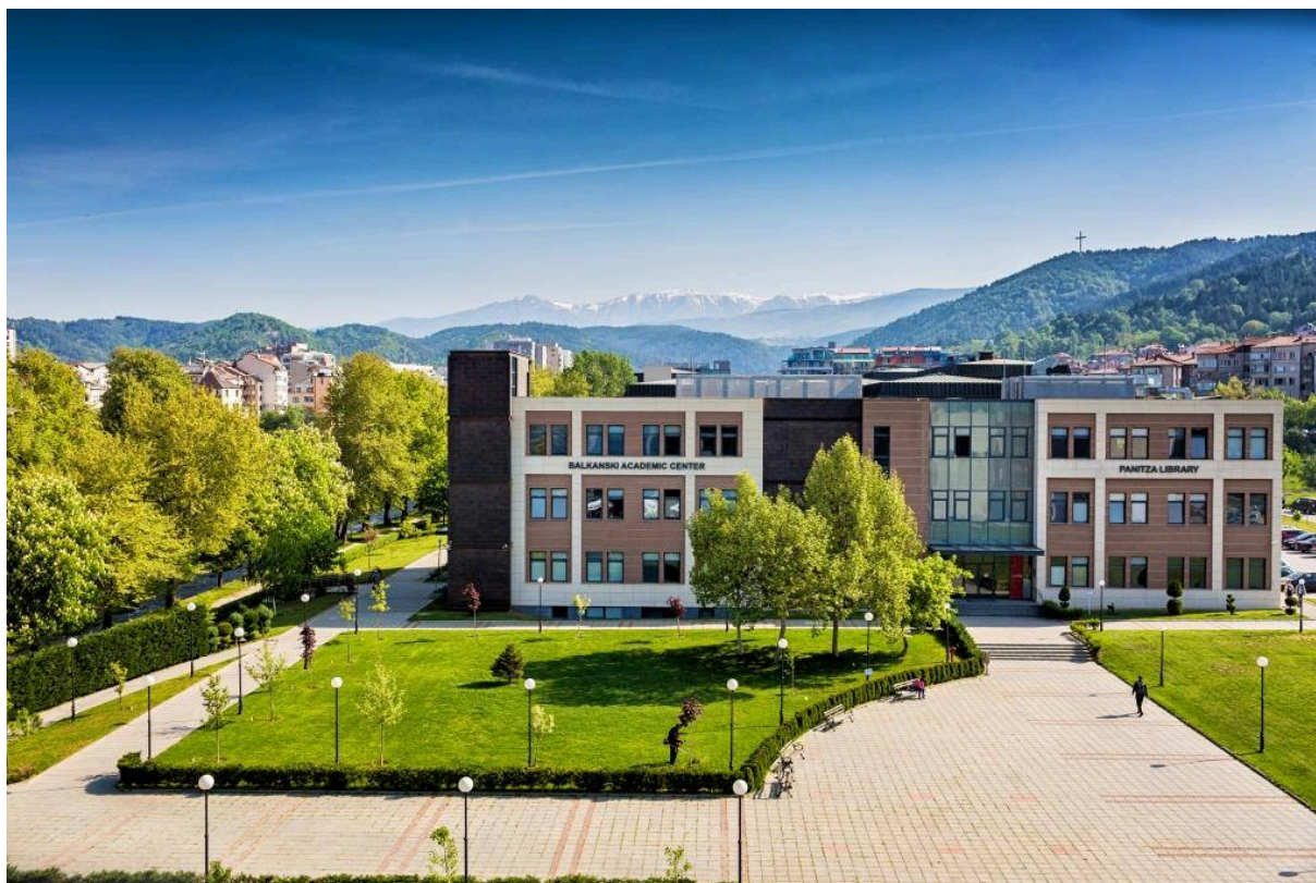
Slika 2:Kamp AUBG

leta 2012. Mednarodnega tedna Erasmus + se je udeležilo 43 profesorjev in koordinatorjev Erasmus iz 11 držav.