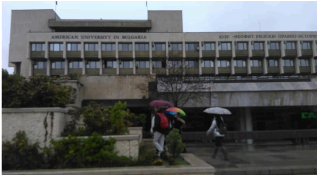
Slika 1: Univerza AUBG